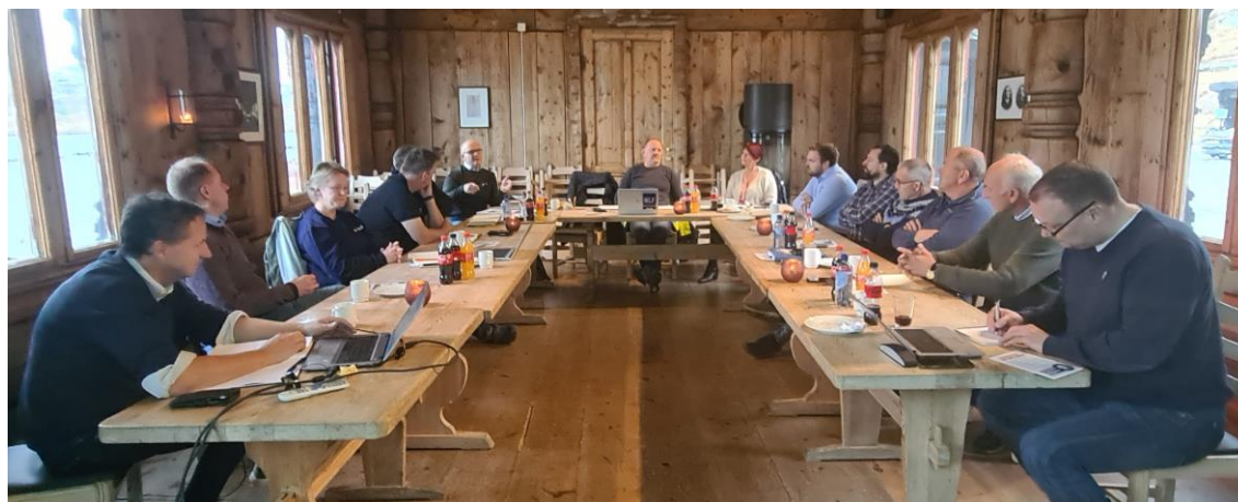
Nøkkelpersoner fra SVV, Mesta, NLF og NLF medlemsbedrifter samlet på Haukeliseter

Statens vegvesen, Mesta og NLF har gjennom lengre tid hatt en god samarbeidsprosess for å få økt oppetid over Haukeli på vinterstid. Tiltak iverksettes fra denne vinteren og ytterligere planlegges til neste år. Enigheten mellom vinterfjellsaktørene ble humoristisk døpt til «Haukeliplattformen».