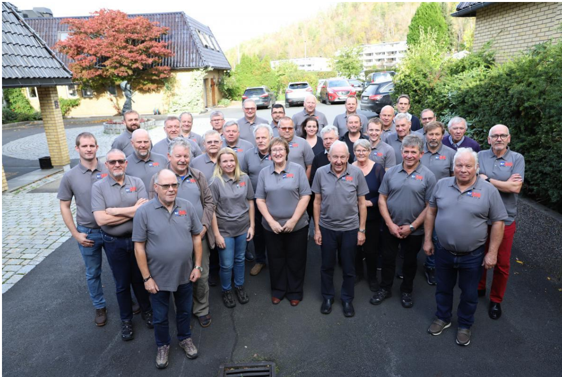
Et knippe NLF Kollegahjelpere samlet i forbindelse med kolegahjelpseminaret på Refsnes Gods i oktober i år.